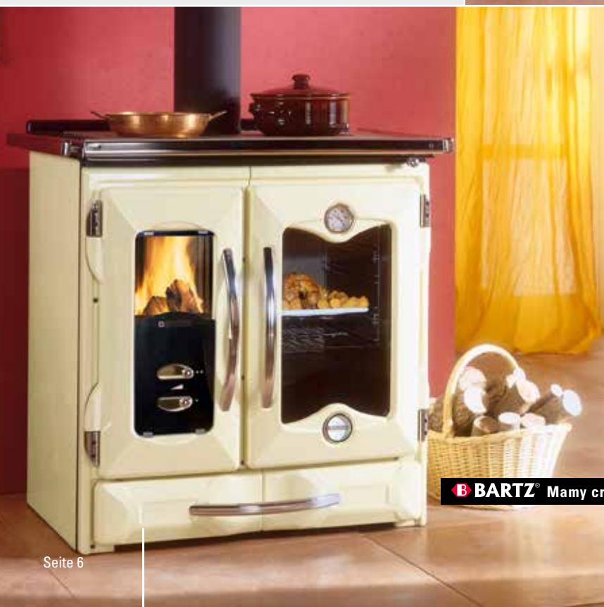
B BARTZ® Mamy crema