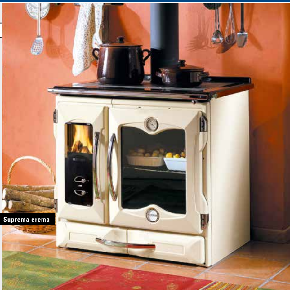
B BARTZ Suprema crema