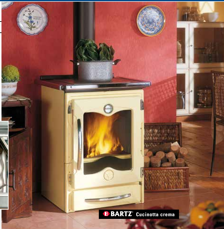
B BARTZ® Cucinotta crema