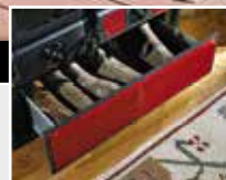
B BARTZ® Rosa liberty pergamena