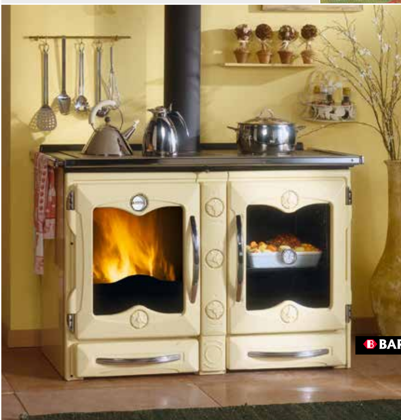
B BARTZ America crema