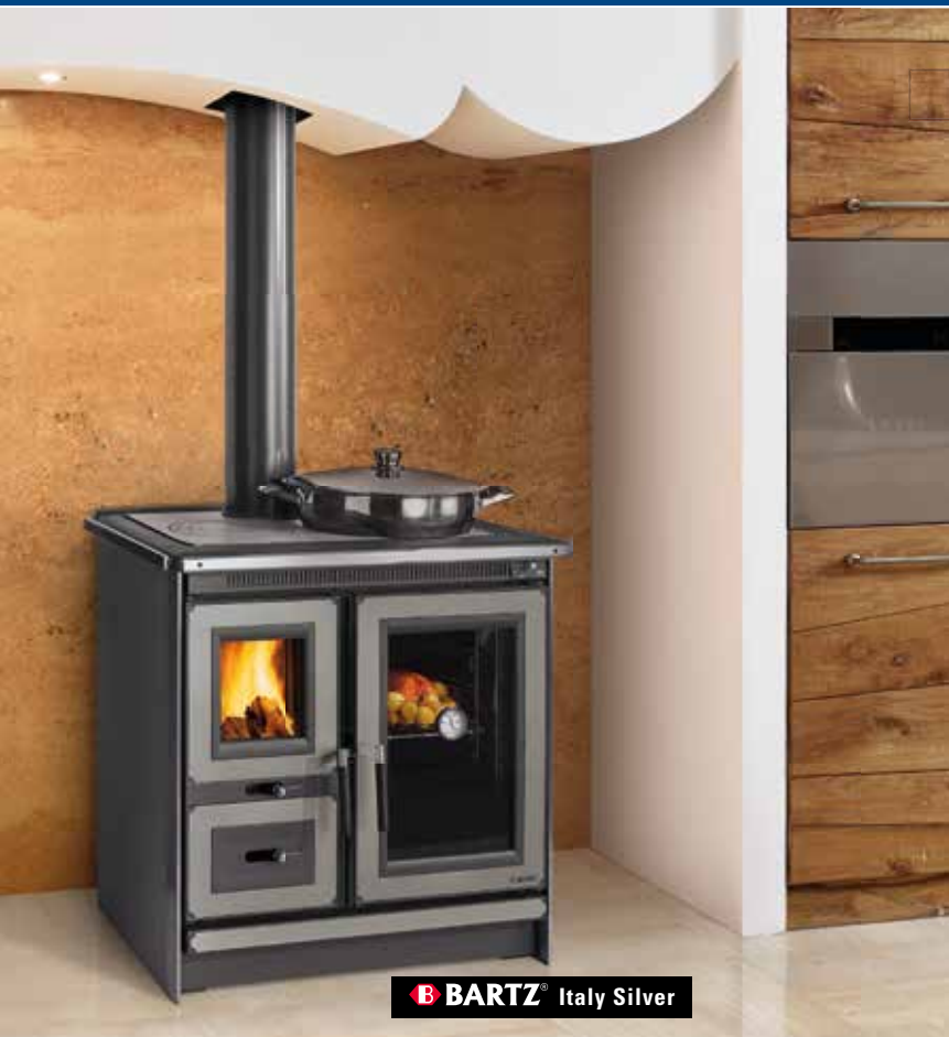
B BARTZ® Italy Silver