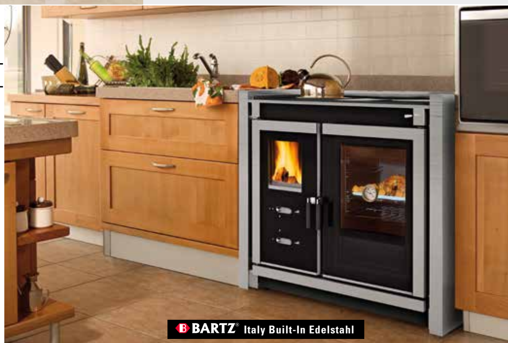
B BARTZ® Italy Built-In Edelstahl